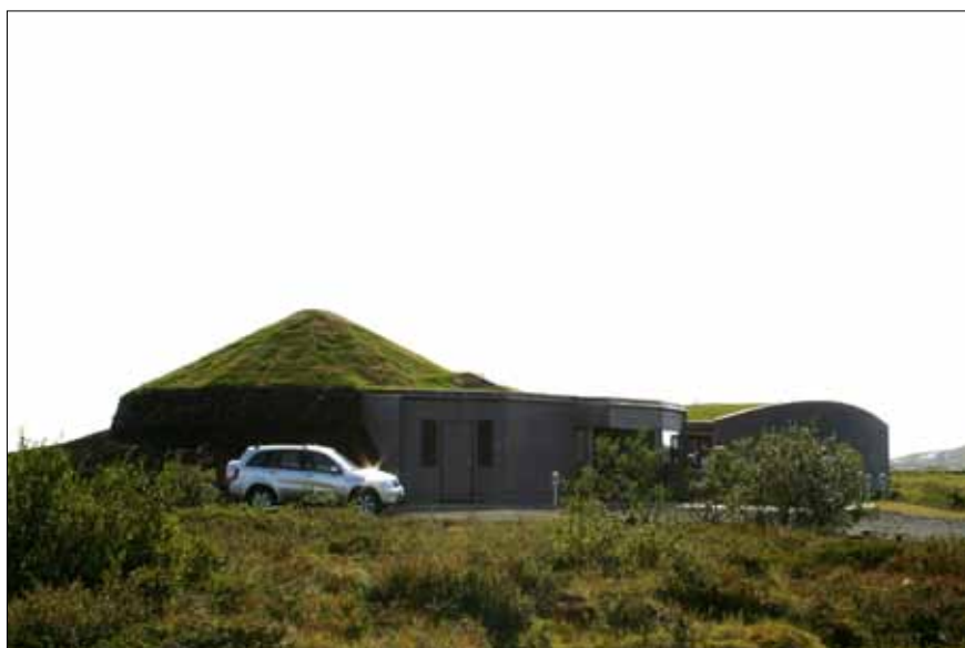
Fuglasafn Sigurgeirs í Ytri-Neslöndum sem Manfreð Vilhjálmsson teiknaði.

Einn Herðubreiðarfélagi fór í stóru 55 manna skemmtiferðina frá Óðins-svæði til Færeyja í júní sl. Sú ferð var ógleymanleg, vel heppnuð með frábærum rútbílstjóra, snilldar fararstjóra og skemmtilegum ferðafélögum og tekið á