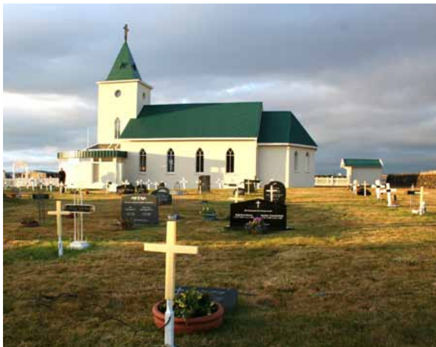
Hluti ljósakrossanna í kirkjugarðinum og Reykjahlíðarkirkja í baksýn.