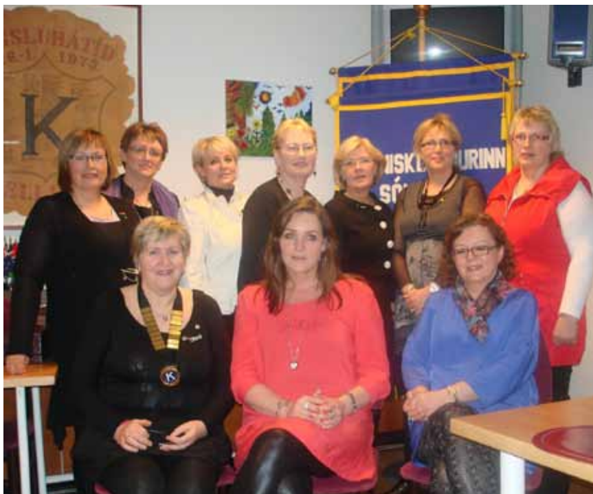
Dyngja, 8. apríl 2011

Þetta fyrsta ár okkar hefur verið afar skemmtilegt og lærdómsríkt að tileinka okkur starfið og kynna innbyrðis, því við komum úr ýmsum áttum. Afar ánægjulegt er hvað okkur hefur á skömmum tíma tekist að mynda þéttan og góðan hóp sem nær vel saman við að byggja upp klúbbinn okkar eins og við viljum hafa hann. Það er mjög spenn-