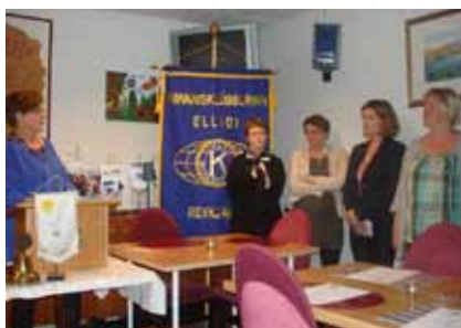
Inntaka nýrra félaga 31. maí

andi og skemmtilegt verkefni að byggja upp nýjan klúbb, móta starfið og gera