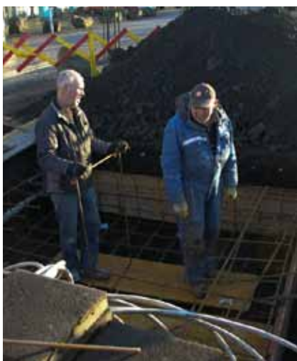
Vinna við skilti Eldborgar

Starfið hjá Eldborg hefur farið vel af stað. Fjölmennt var frá okkur á ágætis umdæmisþingi á Hornafirði. Fórum á fimmtudeginum austur saman í rútu ásamt Sólborgarkonum og nokkrum mökum beggja klúbba. Mikil gleði mikið gaman. Stjórnarskiptafundur var haldinn þ.r.okt með Setbergi og Hraunborgu. Það hefur verið vel mætt á almenna fundi hjá okkur og innra starfið öflugt og skemmtilegt. Við höfum fengið góða ræðumenn á fundina þar sem við bjóðum alltaf uppá mat sem við eldum sjálfir, og afraksturinn af því er settur í sjóð, sem er svo notaður í innra starfið m.a. til að niðurgreiða ýmislegt sem við gerum saman, og hefur það orðið til þess að fleiri sjá sér fært að taka þátt í því sem boðið er upp á. Var sá háttur