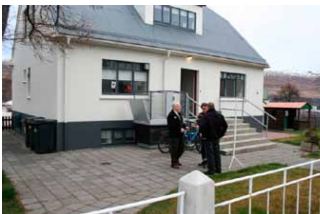
Húsnæði Lautarinnar, athvarf fólks með geðraskanir.